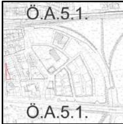
Şekil 2: Planlama Alanına Dair Önemli Alan ve Sınıfı

Çevre ve Şehircilik İl Müdürlüğü tarafından 26.05.2021 tarihinde onaylanan imar planına esas jeolojik-jeoteknik etüt raporunda planlama alanı (ÖA-5.1) yani Önemli Alınabilecek Nitelikte Şişme, Otuma vb Sorunlu Alanlar olarak belirlenmiştir.