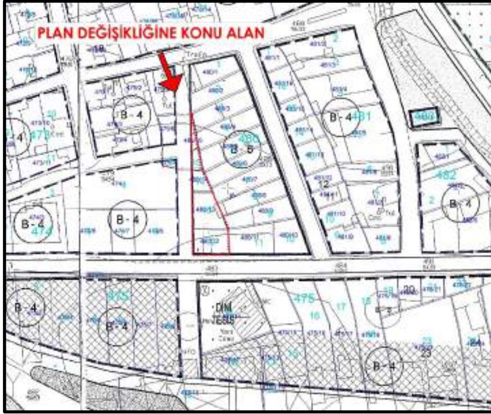
Şekil 5: Yürürlükte Bulunan 1/1000 Ölçekli Uygulama İmar Planı

1/1000 Uygulama İmar Planı deęişikliği önerilen alan, yürürlükte bulunan Ortaklar 1/1000 Ölçekli Uygulama İmar Planında Bitişik Nizam 5 Kat Konut Alanı” kullanım kararı bulunmaktadır.