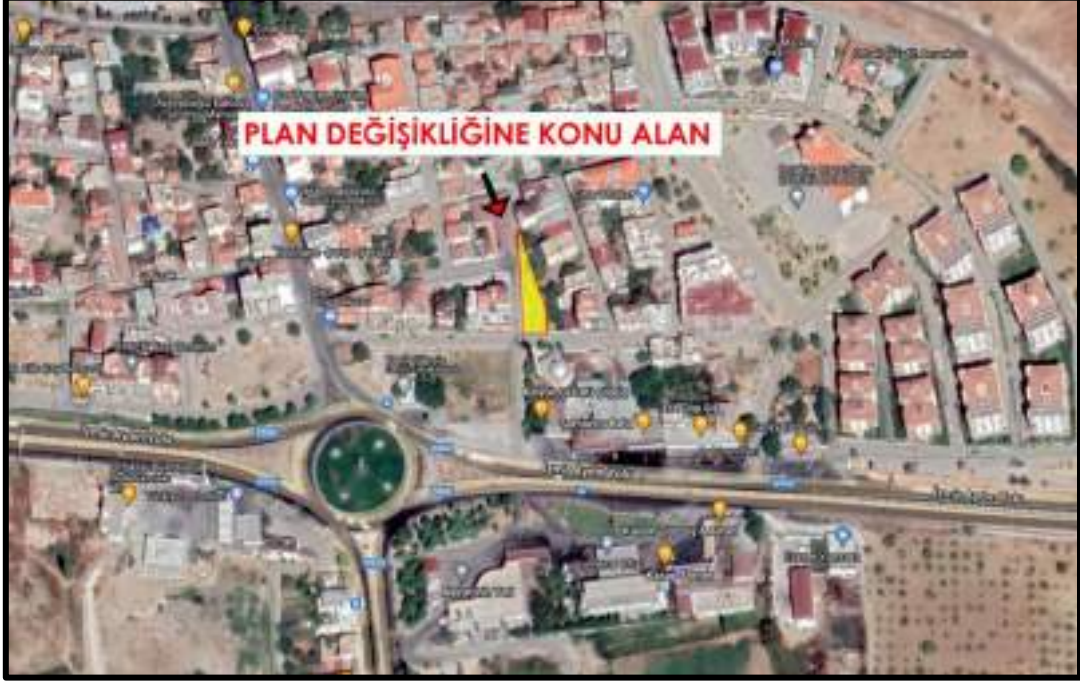
Şekil 1: Planlama Alanına Ait Uydu Görüntüsü

Plan deęişikliğine konu olan alan; Aydın İli, Germencik İlçesi, Ortaklar Mahallesinde 480 adada yer alan tapuda 12,13,14 ve 15 parselleri kapsamaktadır. Plan deęişikliğine söz konusu parseller D 550 İzmir – Aydın karayolunun kuzeyinde yer almaktadır. Germencik ilçe merkezine uzaklığı yaklaşık 8 km'dir.