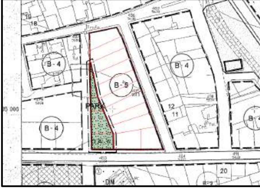
Őekil 6: Öneri 1/1000 Ölçekli Uygulama İmar Planı

İmar adasının çoğunluğunun yapılaşmış olduđu, ancak plan deđiŐikliđine konu olan parsellerin Planlı Alanlar İmar Yönetmeliđindeki standartları karŐılamadıđı için yapılaşamayacak durumda olduđu, söz konusu plan deđiŐikliđi ve sonrasında yapılacak kamulaŐtırma iŐleminden sonra bu mađduriyetin giderilebileceđi, bölgede yeŐil alan miktarının yetersiz olması sebebiyle plan deđiŐikliđi önerisiyle oluŐturulacak "Park Alanı" kullanımının bölgedeki yaŐam koŐullarını iyileŐtirilmesi amaçlanmıŐtır.