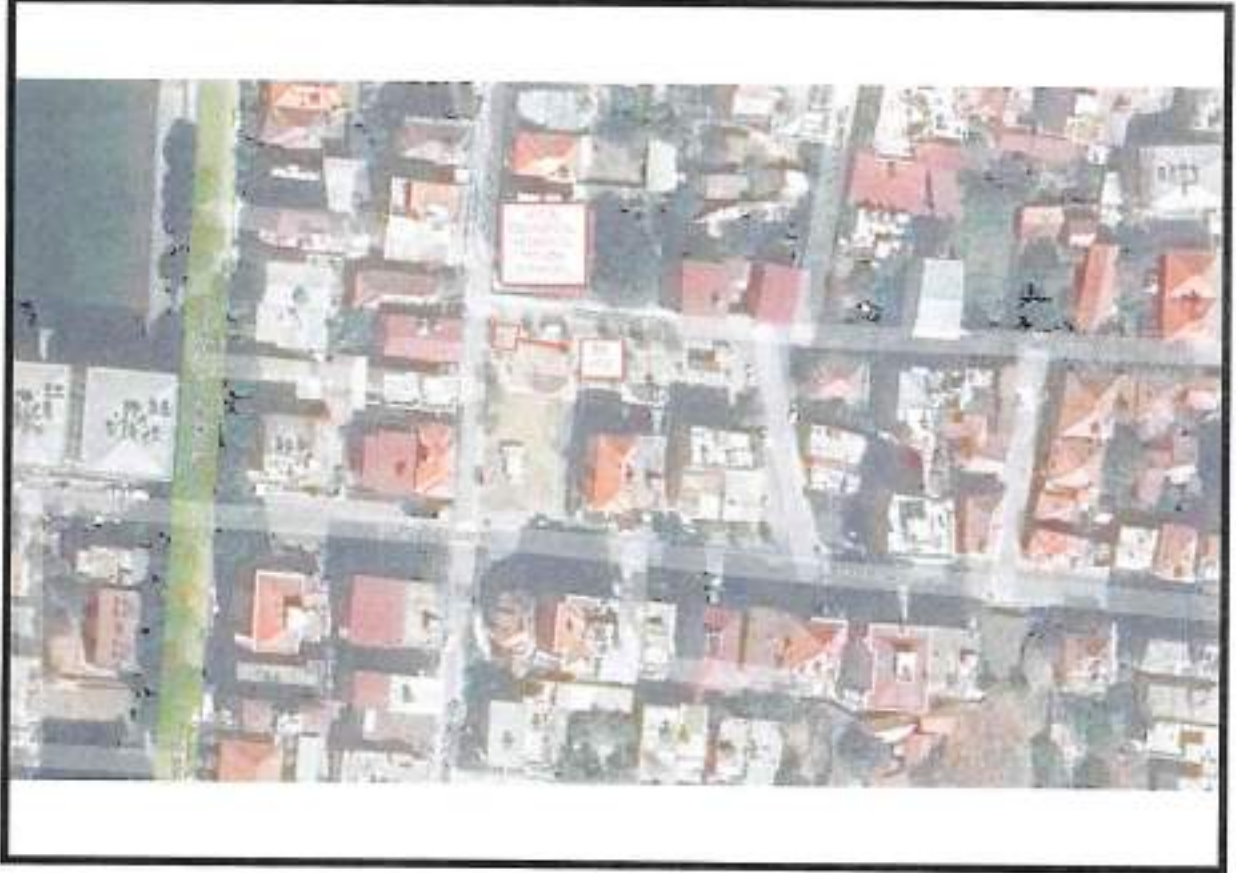
Planlama Alanı Uydu Görüntüsü

Planlama alanı; Aydın İli, Germencik İlçesi, Yedieylül Mahallesi, tapunun 30N-IIIB, 300-IA, 31N-IIIC ve 310-IVD paftalarında, Kore Şehitleri Caddesi üzerinden ulaşılan 1055,99 m 2 yüzölçümlü park alanı ve kuzeyindeki yaya yolunu kapsamaktadır. ENERYA'nın talebi üzerine Park Alanı - Yaya Yolunun Düzenlenmesi ve Regülatör Alanı yapılabilmesi için 1/1000 Uygulama İmar Planı Değişikliği hazırlanmıştır.